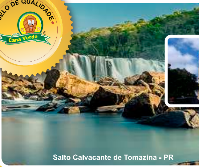
Salto Calvacante de Tomazina - PR