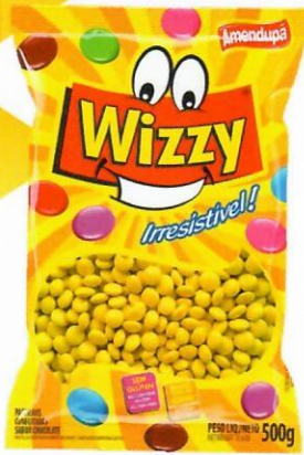
AMARELA Sabor Chocolate 67 500 G CX C/ 10 UNI