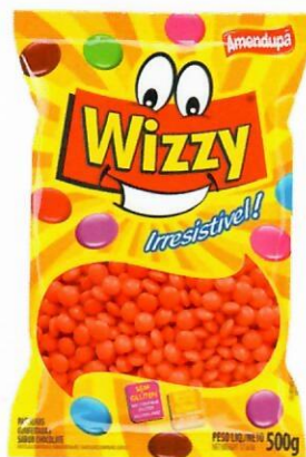
VERMELHA Sabor Chocolate 77 500 G CX C/ 10 UNI