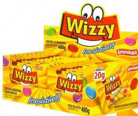
Display SORTIDAS Sabor Chocolate 170 480 G CX C/ 12 DISPLAY C/ 24 UNI