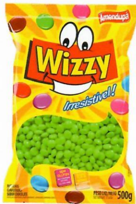
VERDE Sabor Chocolate 68 500 G CX C/ 10 UNI