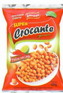
Amendoim Crocante Sabor Pimenta com Limão