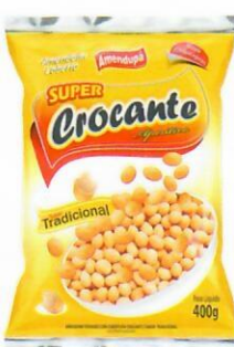
Amendoim Crocante Sabor Tradicional