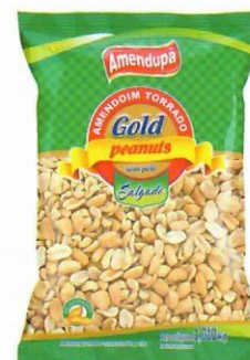
Amendoim GOLD Torrado s/ Pele Salgado