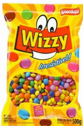
SORTIDAS Sabor Chocolate 97 500 G CX C/ 24 UNI