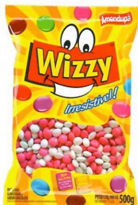
BRANCA E ROSA Sabor Chocolate 73 500 G CX C/ 10 UNI