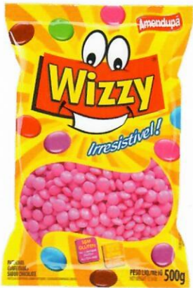
ROSA Sabor Chocolate 69 500 G CX C/ 10 UNI