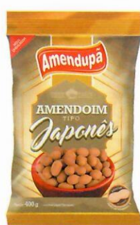
Amendoim Tipo Japonês