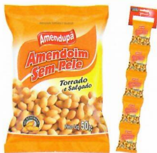
Amendoim sem Pele Torrado e Salgado