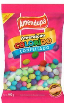
Amendoim Confeitado Colorido