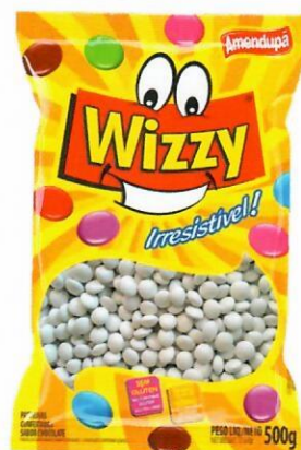
BRANCA Sabor Chocolate 71 500 G CX C/ 10 UNI