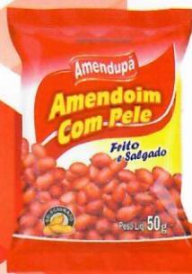
Amendoim com Pele Frito e Salgado