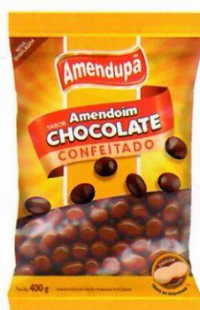
Amendoim Confeitado Sabor Chocolate