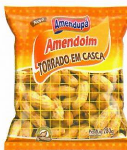
Amendoim Torrado em Casca