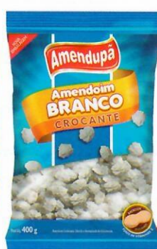
Amendoim Branco Crocante