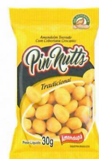
Amendoim Crocante PIN NUTTS Sabor Tradicional