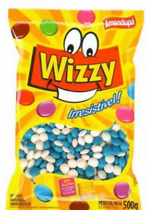
BRANCA E AZUL Sabor Chocolate 74 500 G CX C/ 10 UNI