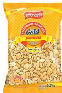
Amendoim GOLD Torrado s/ Pele e s/ Sal