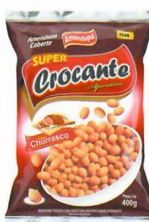
Amendoim Crocante Sabor Churrasco