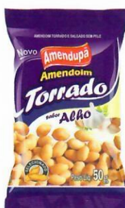
Amendoim Torrado Sabor Alho