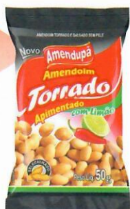
Amendoim Torrado Apimentado c/ Limão