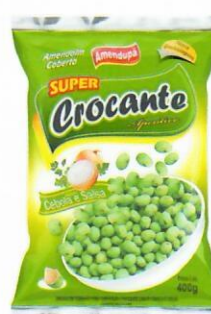
Amendoim Crocante Sabor Cebola e Salsa