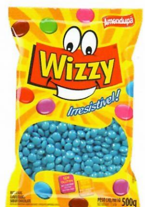
AZUL Sabor Chocolate 70 500 G CX C/ 10 UNI